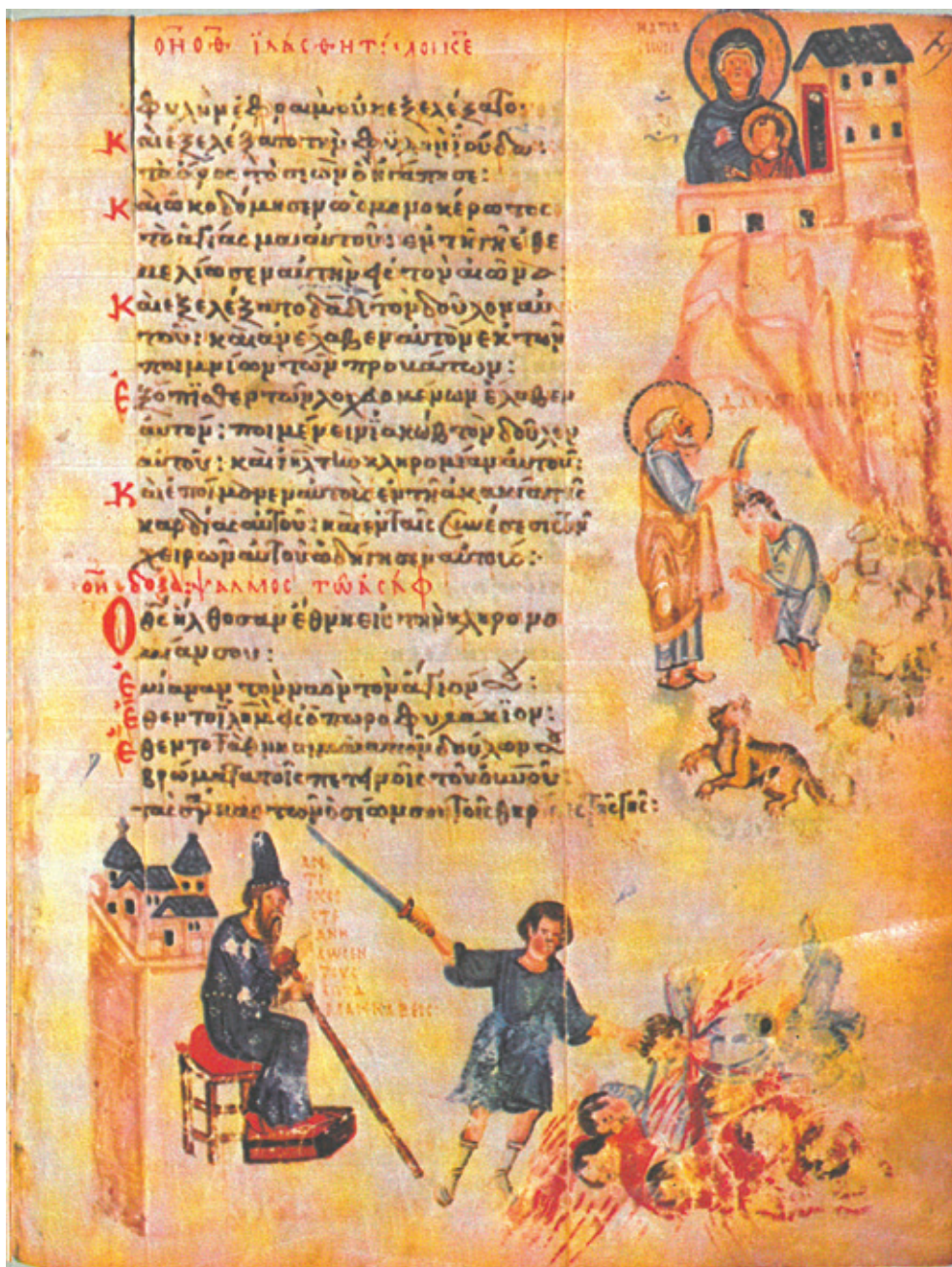
Сл. 11. Гора Сион и Миропомазање Давида за цара [Пс 77 (78): 68–70] Москва, Државни историјски музеј, 129g, fol. 79 r (IX век)