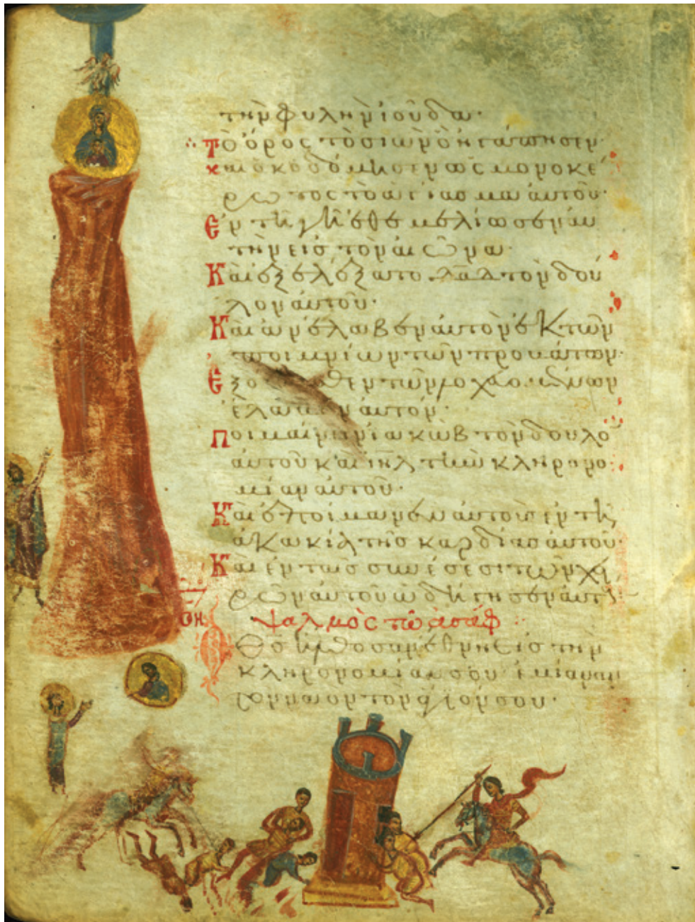
Сл. 12. Гора Сион и цар Давид [Пс 77 (78): 68–70] Балтимор, Уметнички музеј Волтерс, W733, fol. 43v (с. 1300)