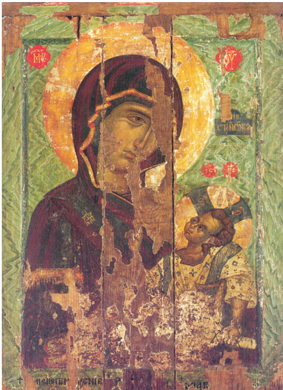
Сл. 10. Богородица Необориме стене са Христом Хиландарска ризница (крај XIV – почетак XV века)