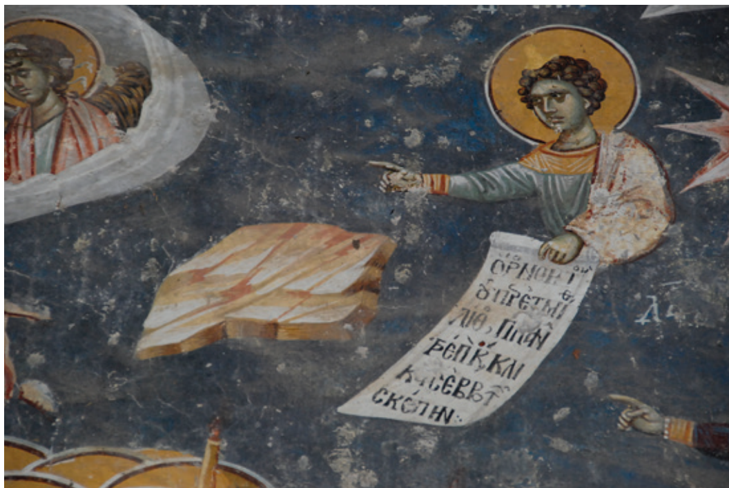
Сл. 9. Успење Богородице – Пророк Данило и стена (деталј) Старо Нагоричино, Црква Светог Ђорђа, припрата, западни зид (1317/1318)

монументалног програма Цркве Христа Пантократора у Дечанима (1346/1347), композиција Навуходонооровог сна на јужном зиду западног травеја смештена је међу старозаветне теме које са околним живописом творе специфичну ликовну целину обједињену идејама икономије спасења и установљавања будућег царства Божијег, отпочетог инкарнацијом Логоса (Милановић 1995: 213–219, сл. 3; Тодић, ЧАНАК-МЕДИЋ 2005: 356–360).