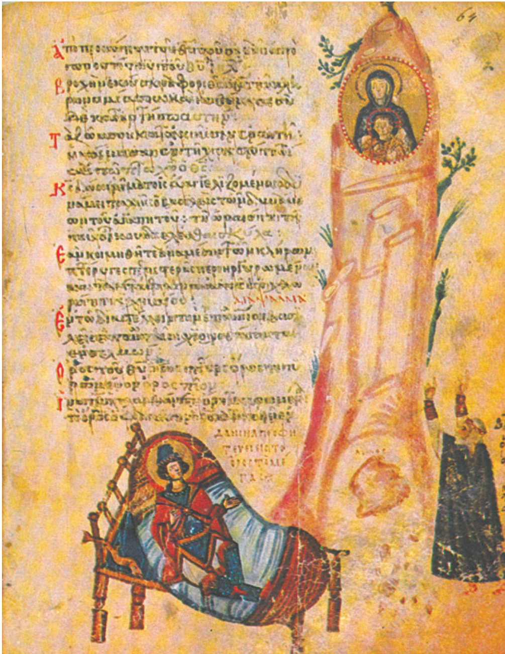
Сл. 1. Навуходносоров сан [Пс 67 (68): 15–16] Москва, Државни историјски музеј, 129g, fol. 64 r (IX век) (фото: Щепкина 1977: л. 64)