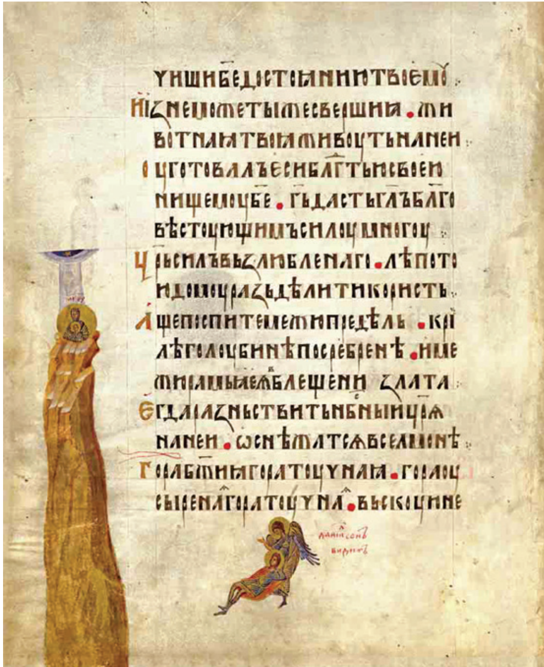
Сл. 4. Навуходоносоров сан – визија пророка Данила [Пс 67 (68): 15–16] Санкт Петербург, Руска национална библиотека, 1252 F VI, fol. 88 v (1397)