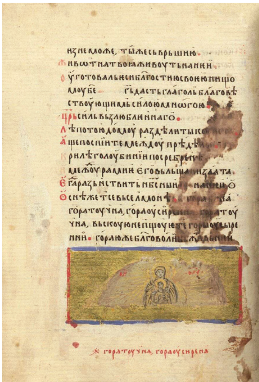
Сл. 5. Богородица Гора [Пс 67 (68): 15–16] Минхен, Баварска државна библиотека, Cod. Slav. 4 , fol. 85v (друга половина XIV века)